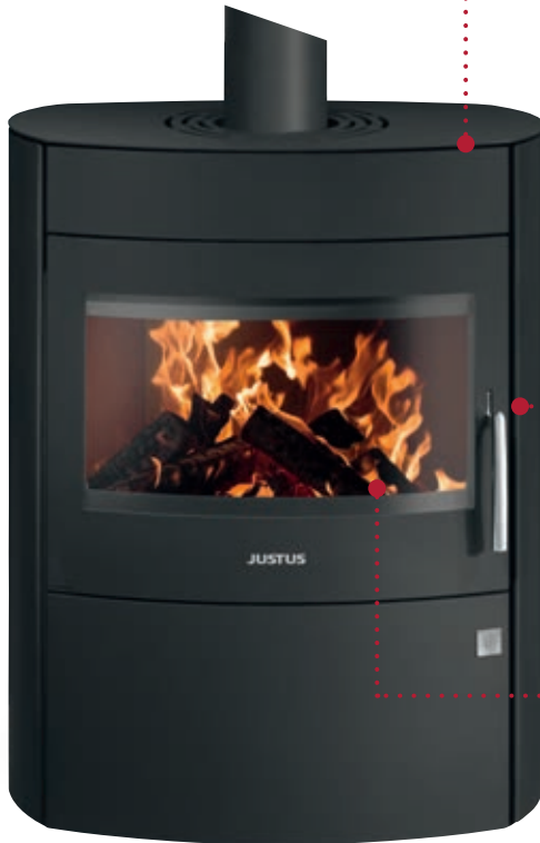
Agero 2.0 Korpus Stahl Schwarz