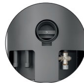
Island Aqua Sandstein, Korpus Stahl Schwarz